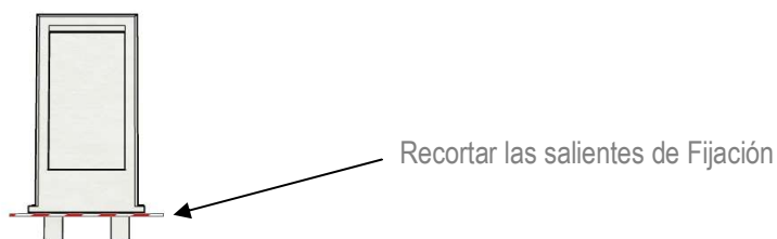
Figura 2 - Recorte de las salientes de fijación

La segunda opción es recortar las salientes que tiene el panel y pegarlo en la superficie de la maqueta.