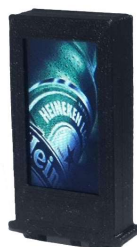
Figura 3 - Ejemplo de encendido

A partir de ahí se sucederán diferentes imágenes de publicidad que cambiarán cada 10 segundos, de forma continua.